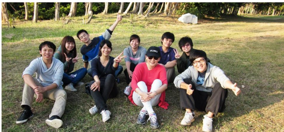
馬教授常常與學生騎腳踏車暢遊高雄

技術上，從兩項專案中我學會撰寫SAS、VBA程式語言有效處理大量數據資料、計量模型方法、Word文檔排版與PPT投影片設計等技巧，其中最深刻的印象為自己當初那「獨特」的投影片設計品味，總是被眾人所抨擊，初始自己認為外表不是重點，內容才是主角。其實，在不斷閱讀大量文獻後，整理成一份讓人清晰易懂的報告流程之外，更要將報告的內容包裝至足以吸引眾人之目光，才是一項成功並精彩的「演出」。